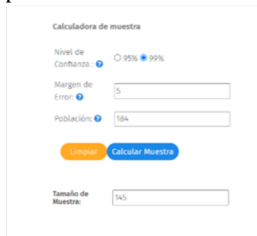
Ilustración 1. Cálculo de la población muestra