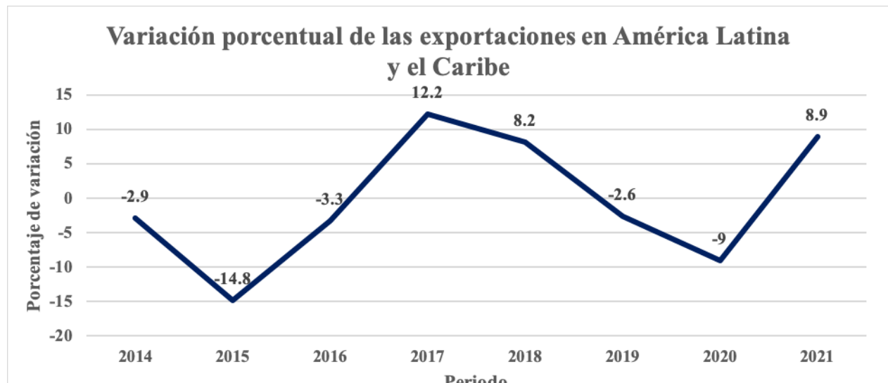
Gráfica 1. Variación porcentual de volumen de comercio mundial.

En la gráfica 1 se puede observar el comportamiento de la variación porcentual del volumen de exportaciones, de acuerdo con los datos proporcionados por la Organización Mundial del comercio (2021). Dicho volumen comenzó una etapa de descenso a partir del primer trimestre de 2018, situación que se fue agravando hasta tocar su punto más bajo en el segundo trimestre de 2020, coincidiendo en temporalidad con la crisis sanitaria de la COVID-19. Sin embargo es importante destacar que después de casi dos años comienza a observarse una ligera recuperación de dicho volumen.