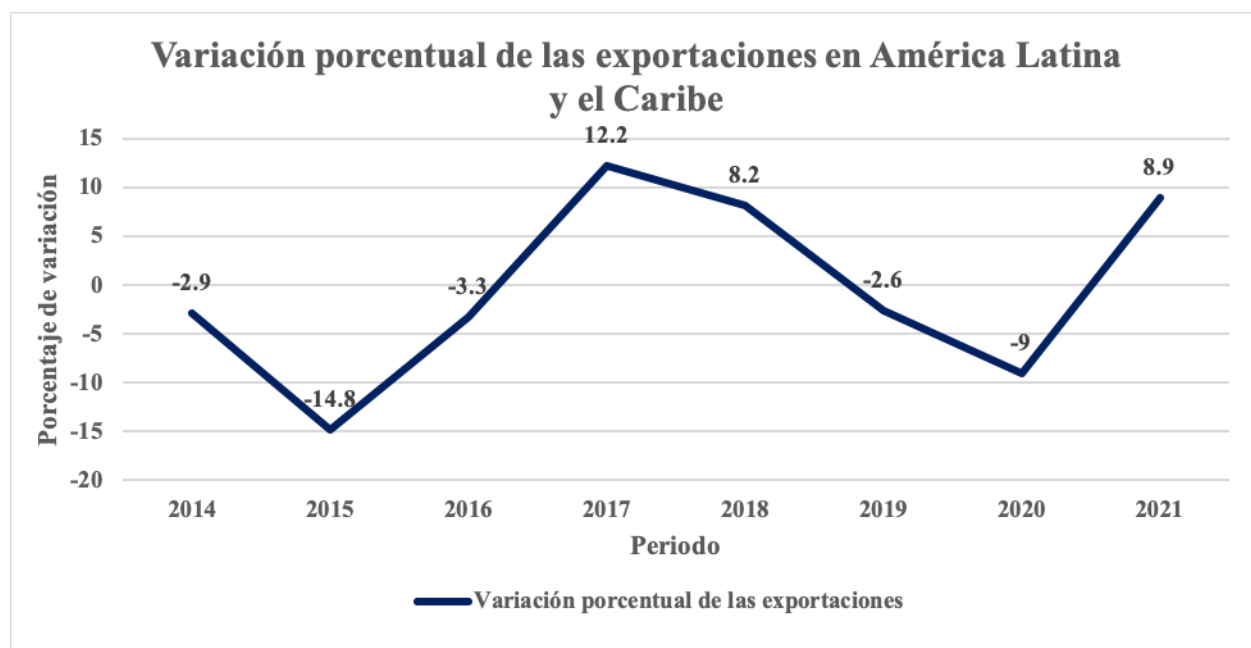
Gráfica 2. Variación porcentual de las Exportaciones en América Latina y el Caribe.

El gráfico 2 muestra la variación porcentual de las exportaciones realizadas por América Latina y el Caribe durante el periodo de 2014 a la fecha, efectuada partiendo de datos proporcionados por el Banco Interamericano de Desarrollo (2021). Puede observarse claramente que los periodos de decrecimiento más grande coinciden con la época de mayor tensión ocasionada por la pandemia. Durante 2020 se registró la máxima caída en el nivel de exportaciones, situación que parece mostrar una recuperación en el acumulado de 2021, observándose una mejora del 8.9% que indica un notable cambio en la tendencia y conduce a lo que parece ser un crecimiento en dicho nivel.