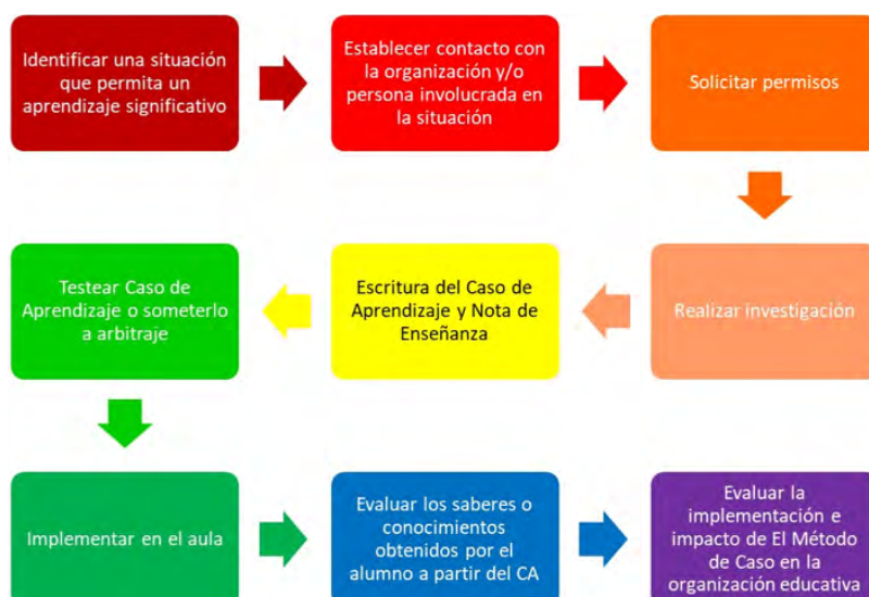
Figura 3. Fases o etapas del método de caso

De ahí que sea posible considerar al método de caso como una estrategia didáctica por el impacto que puede tener en una materia o curso, en un currículo. Éste se compone de varias fases, a saber: